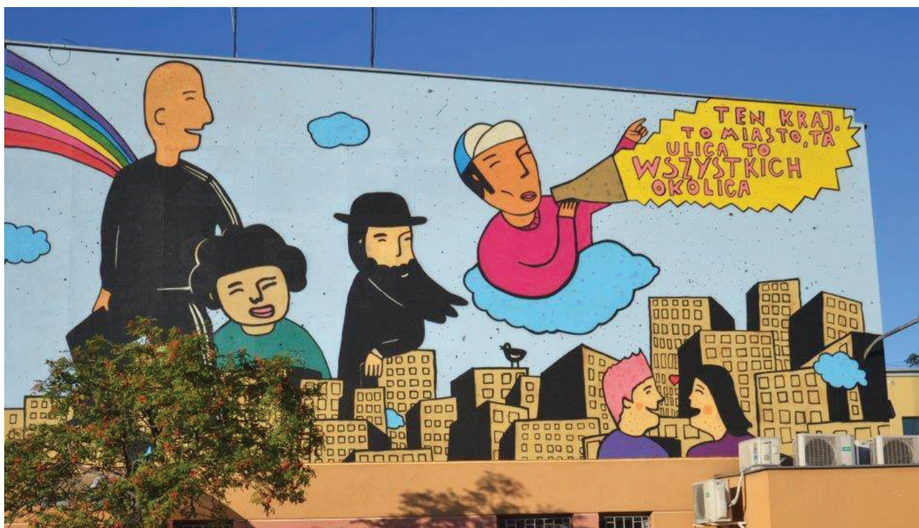
Mural „Zgierz Otwarty” wykonany w ramach „Wielokulturowego Zgierza”

Mieszkając w Zgierzu, Łodzi czy innym mieście aglomeracji łódzkiej nie sposób uciec od przemysłowej tożsamości. Nasze miasta zostały stworzone przez tkaczy i przemysł włókienniczy. Czujemy mocny związek z tym kulturowym i historycznym dziedzictwem, dlatego „Tkalnia” była dla nas naturalnym wyborem przy nazywaniu naszego wspólnego przedsięwzięcia.